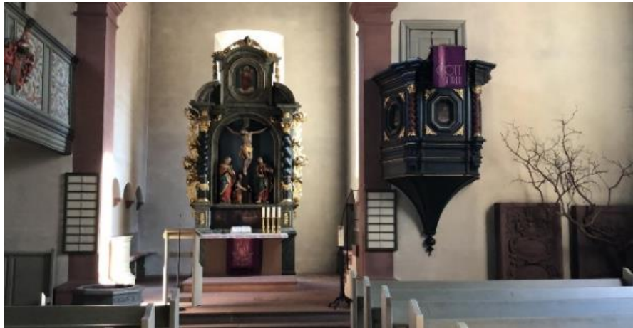
Bild: Leere Kirche zu Ostern 2020; rechts im Bild: der noch unbenutzte, leere Tauf-Baum!

Zusätzlich konnten die Kirchenbesucher (Gottesdienste durften leider nicht stattfinden) von uns vorgebastelte Sterne direkt in der Kirche beschriften!