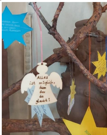
Bild links: Es dürfen wieder Gottesdienste (somit auch Taufen) gefeiert werden - der erste Taufengel kommt am 27.6.2020 mit an den Tauf-Baum - der in der Pandemie ganz anders als geplant verwendet wurde.